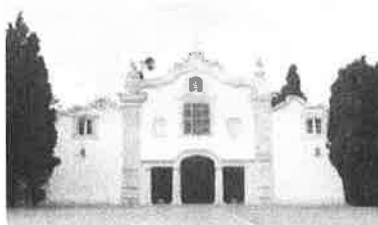
Convento dos Capuchos