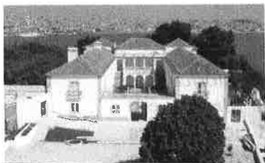
Casa da Cerca