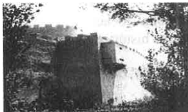
Forte de Almada