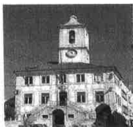
Paços do Concelho