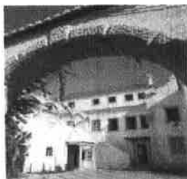
Convento de S. Paulo