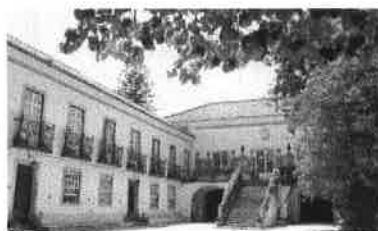
Solar dos Zagalos