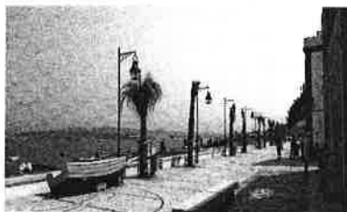
Passeio Ribeirinho - Trafaria