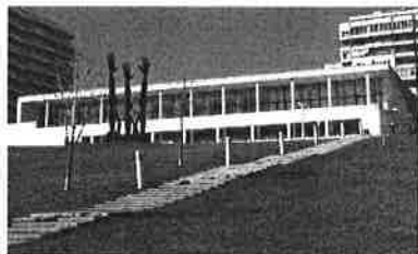
Fórum Romeu Correia – Almada