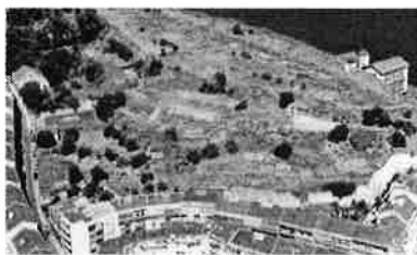
Almaraz/Ginjal - Cacilhas