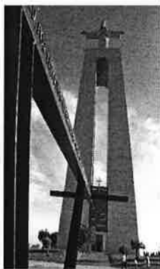
Cristo Rei – Pragal