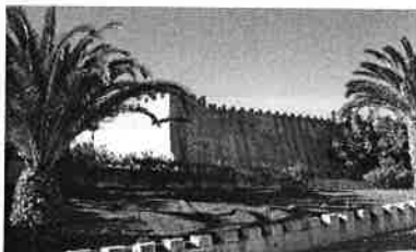
Castelo de Almada – Almada