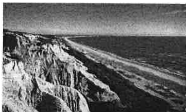
Arriba fóssil – Costa de Caparica