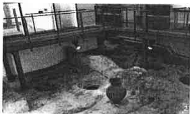
Museu do Sítio – Almada