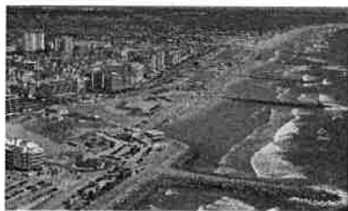
Vista panorâmica – Costa de Caparica