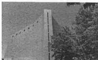
Teatro Azul - Almada