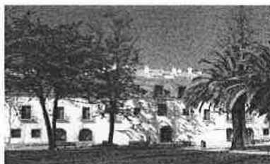
Museu da Cidade – Cova da Piedade