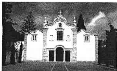
Convento dos Capuchos – Caparica