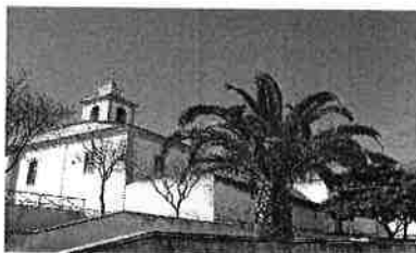
Convento de S. Paulo - Almada