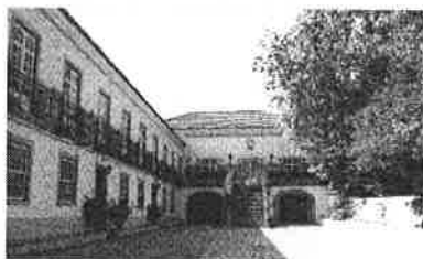
Solar dos Zagallos - Sobreda