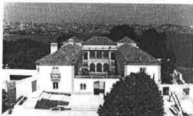
Casa da Cerca – Almada