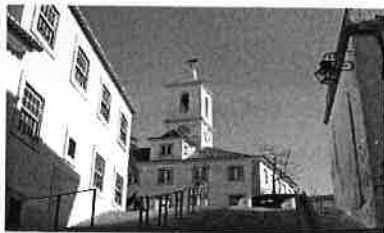
Paços do Concelho – Almada