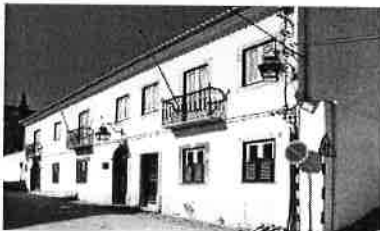
Arquivo Histórico – Almada