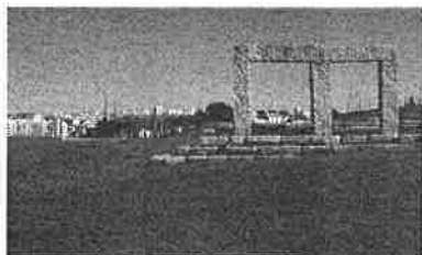
Parque da Paz – Cova da Piedade