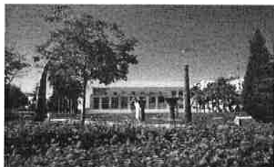
Complexo Desportivo – Feijó